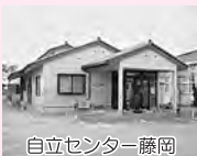
自立センター藤岡