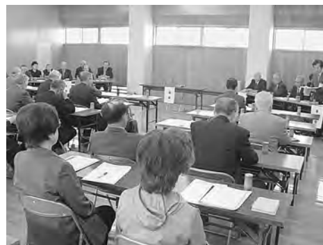
平成22年3月30日(火)に開催された第159回理事会、第107回評議員会において、平成22年度事業計画・予算が承認されました。

本市に居住していた、篤志家からの遺贈により、本会が取得した土地を貸付て得られた利用料を処理するための会計で、収益を社会福祉事業に使用するため法人運営経理区分へ繰り出しております。