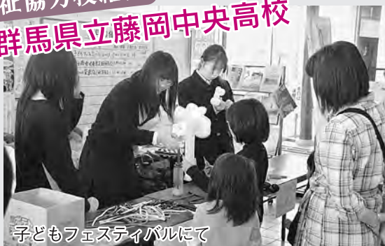
子どもフェスティバルにて

創立当初より「ボランティア活動の藤岡中央」を目指し、地域と連携したボランティア活動を実践しています。これまでインターアクトクラブ、ボランティア委員会、生徒会を中心に、ペットボトルキャップやプルタブ、古紙の回収に取り組み、発展途上国の子供達のための学校設立やワクチン購入等に協力してきました。また、「子どもフェスティバル」や「藤岡まつり」のお手伝いもしました。今後は全校生徒のボランティア意識を高め、さらに活動の輪を広げていきたいと考えています。