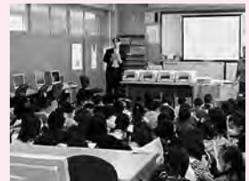
昨年美土里小で行われた 福祉講演会の様子