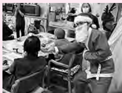
デイサービス栗須