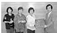
J A たのふじ みりの会