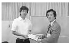
連合群馬藤岡地域協議会