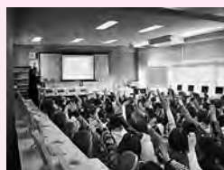
美土里小福祉講演会

県学童・生徒のボランティア活動普及事業の指定 (地域指定福祉協力校モデル事業) 西中学校区 (期間 平成21年度より3ヶ年)