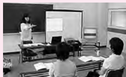
手話奉仕者養成講座