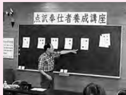
点訳奉仕者養成講座