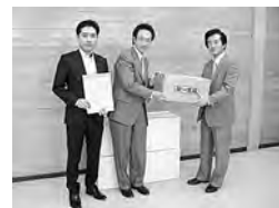
第一生命保険(株)労働組合