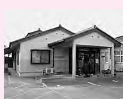
自立センター藤岡