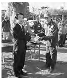
藤岡市グラウンドゴルフ協会