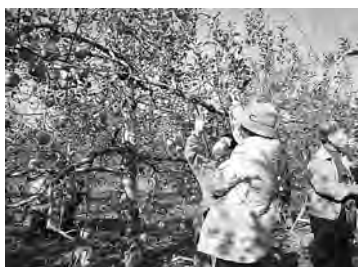
野外活動への同行