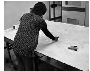
マップ作成の様子

災害発生時、何らかの障害により避難することが難しい方を対象とした名簿及びマップの作成を行っています。この名簿(マップ)は、年1回すべての委員協力のもと更新され、民生委員・児童委員担当課、防災担当課で保管を行い、災害時に活用されます。このマップ作成には、社会福祉協議会も協力しています。