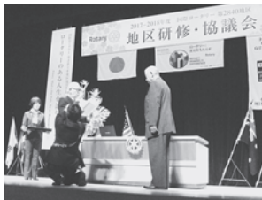
藤岡ロータリークラブ