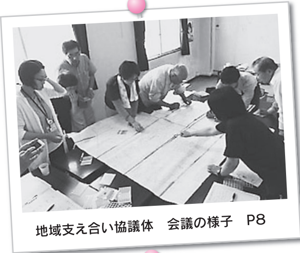
地域支え合い協議体 会議の様子 P8