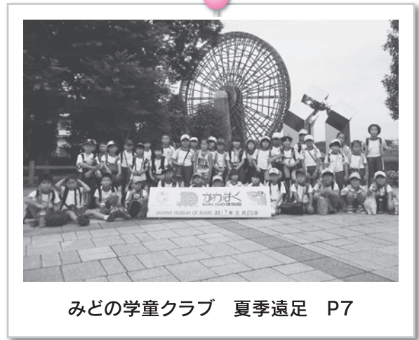
みどの学童クラブ 夏季遠足 P7