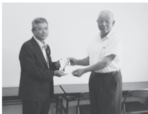
メセナ(株)アシストホール藤岡