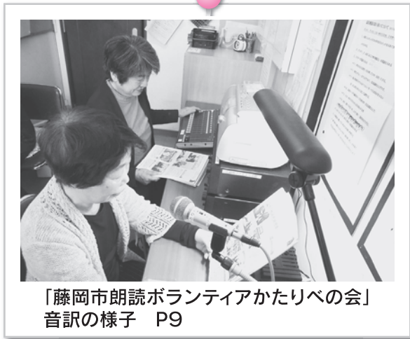
「藤岡市朗読ボランティアかたりべの会」音訊の様子 P9