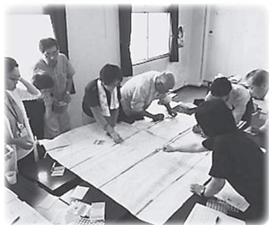
地図を用いて、小野地区の店舗や施設を確認中

2025年問題に備えて、自分たちの住んでいる地域の「困りごと」を 解決するための「仕組みづくり」について話し合っています。