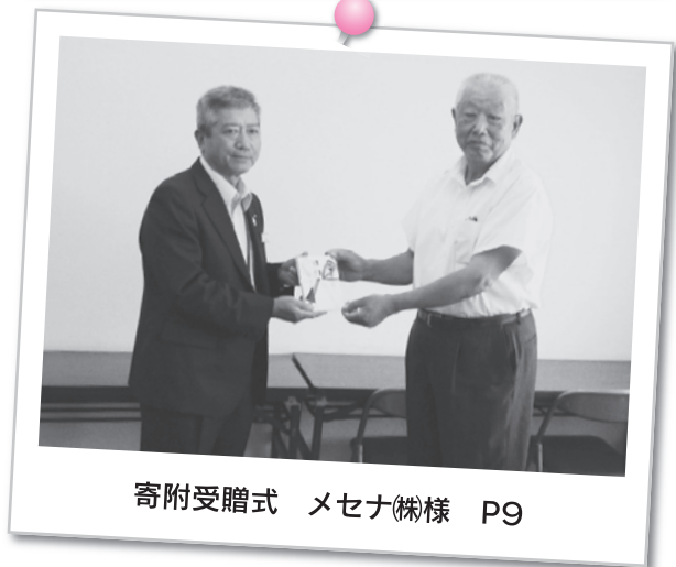
寄附受贈式 メセナ様 P9