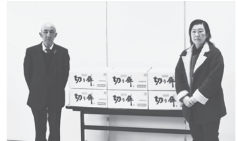
たくさんのお餅をいただきました