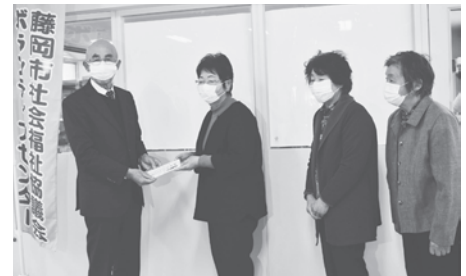
JA多野藤岡助けあいネットワークみのりの会