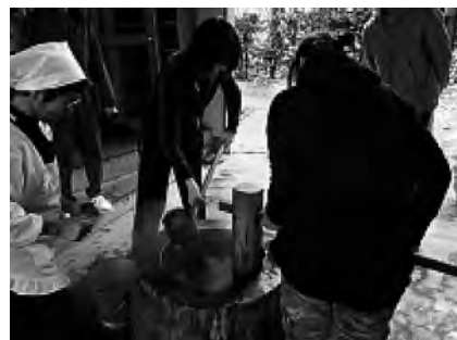
ぐんま学園の餅つき大会の様子

人間を相手にするボランティア活動ですから、少年の非行の現状や心理、教育などについて勉強会に参加するなどのほか、自分で調べたり、会員同士で情報交換をしています。