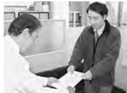
ユニー㈱ピアゴ藤岡店