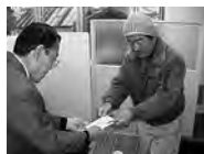
藤岡市少年野球連盟