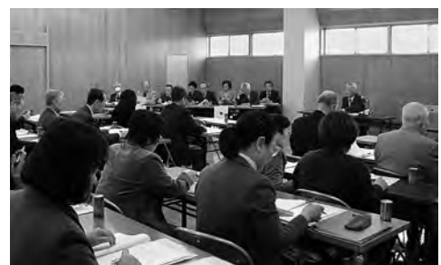
第113回評議員会の様子