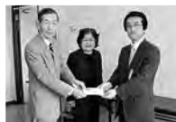
藤岡市老人クラブ連合会