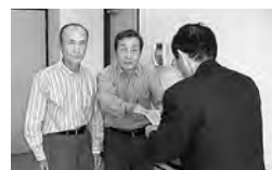
市光工業藤岡OB会一同