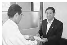
多野藤岡農業協同組合