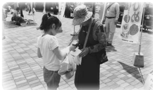
ボランティア連絡協議会による募金活動(ららん藤岡にて)