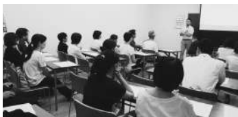
手話で楽しい会話ができるように... 熱心に受講中

今年度は、入門コースに23名と多くの受講生が受講し、技術を習得するため熱心に学んでいます。