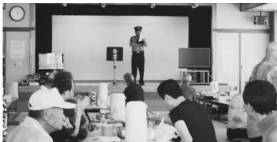
詐欺を未然に防ぎましょう

「おかしと思ったら、家族、警察に相談する ことが、被害防止につながる」とお話されました。