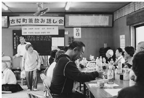
和気あいあい古桜町交流会

また、納涼祭、子ども祭り、どんど焼きなどの公民館の活動も支援して、世代間の交流の推進にも取り組んでいます。