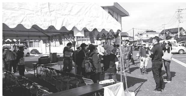
台風19号による被災地災害支援として、藤岡市社会福祉協議会から、群馬県富岡市、栃木県佐野市へ5名、計17日間派遣しました。