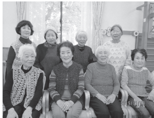
手編みの衣類は、藤岡市高齢者自立センターを利用されている方に差し上げました。暖かいと好評です。