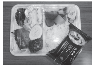
うるち米、即席みそ汁は配食サービス等に活用させていただきました。