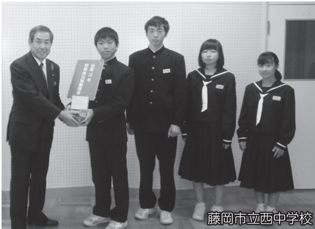
藤岡市立西中学校