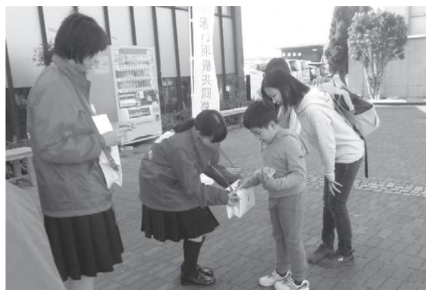
連合婦人会や藤岡中央高等学校の生徒の皆さまにもご協力いただき、街頭募金を行いました。