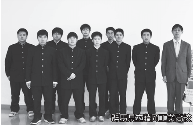
群馬県立藤岡工業高校

昨年秋、台風19号による大規模な災害が発生したことは記憶に新しいことと思います。