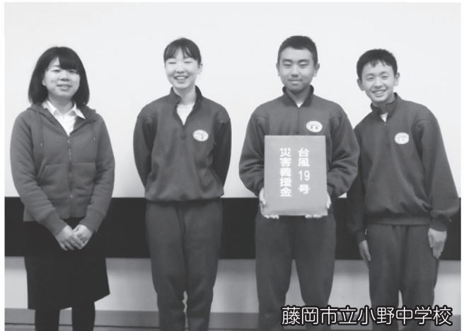
藤岡市立小野中学校