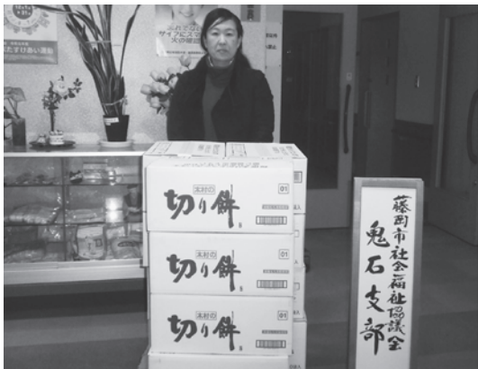
ご寄附いただいたお餅は藤岡市社会福祉協議会鬼石支部を通じて地域の方々へ配布しました。